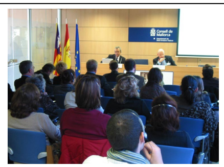
Plenary session at the Regional Seminar in the Regional Council of Mallorca