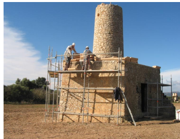
Restoration work at a former wind mill