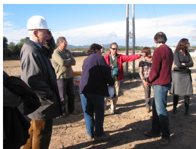
Visiting mill restoration works at Porreres, Mallorca

Il coinvolgimento e l'attivo contributo di tutti i partner è necessario per assicurare l'ulteriore progresso dell'intero progetto CULTURED.