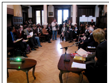
During the Regional Seminar in Rokiskis Manor, Panevezys region (Lithuania)