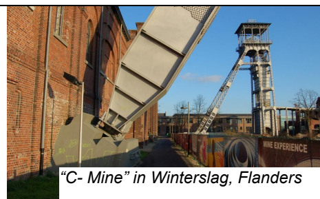
"C- Mine" in Winterslag, Flanders