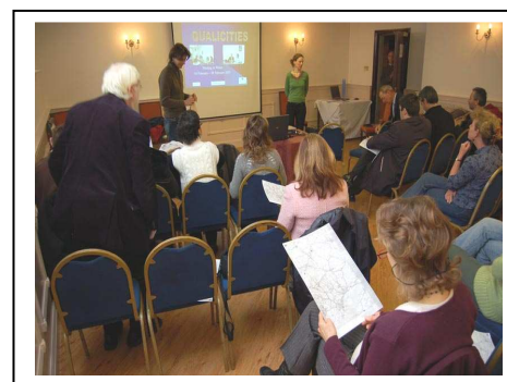
Presentation of QUALICITIES approach