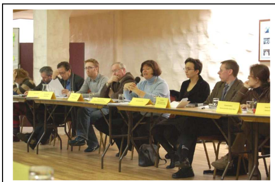
Feedback degli esperti sulle linee guida

Dopo i seminari regionali di disseminazione organizzati alla fine del 2006 in tre regioni partner del progetto, il più recente workshop in Galles si è focalizzato ancora sugli elementi concreti e sui materiali da costruzione per il restauro dell'eredità culturale. Da quando il progetto è partito due anni or sono, molto materiale è stato ottenuto grazie al metodo dei questionari tematici. Un cambiamento importante tuttavia è stato quello di considerare uniti i quattro argomenti (politica, normative, tecniche di restauro e valore aggiunto) in modo da includerli nelle linee guida per la valorizzazione dei beni culturali periferici.